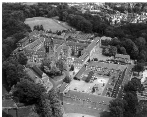
Skal vi virkelig bo her?

I 1999 deltog 32 klubmedlemmer i turen til motionsudgaven af Liège-Bastogne-Liège, og vi håber at kunne samle et tilsvarende hold i år. Se også vedlagte ark med billeder fra løbet.